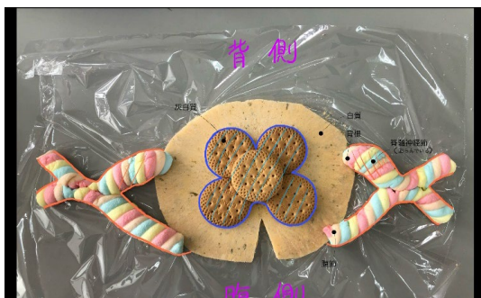
図 3.駄菓子で作る神経系(生徒成果物)